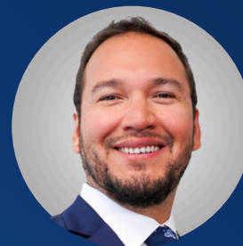
Daniel Palomino Estudio Muñiz